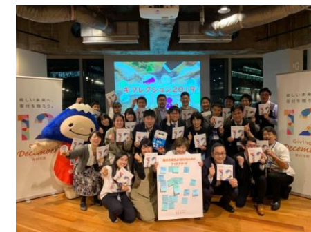
クロージングイベント: キフレクション