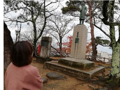
寄付にまつわる場所を巡るきふたび