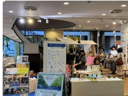
寄付でつなぐ未来へのバトン