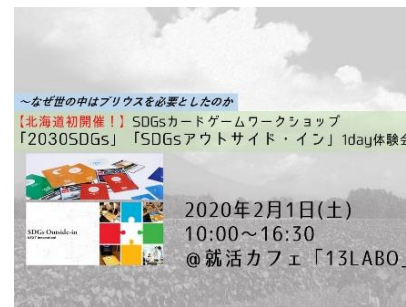
寄付と SDGs カードゲーム WS