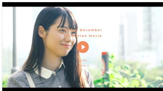
5周年記念 PV を制作