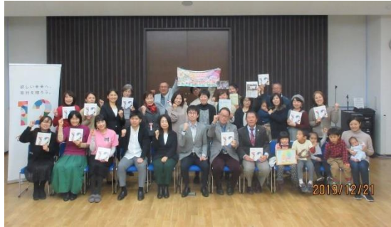
くまもと おもやいアワード