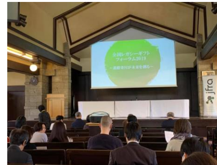
全国レガシーギフト・フォーラム