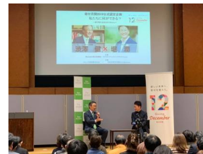
澁澤健×堀潤 対談 SDGs セミナー