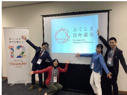
ふくしま百年基金シンポジウム