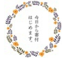
寄付・遺贈の窓口開始@横浜市社協