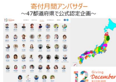
全 47 都道府県に 60 名のアンバサダー