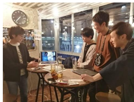
Giving Tuesday 静岡