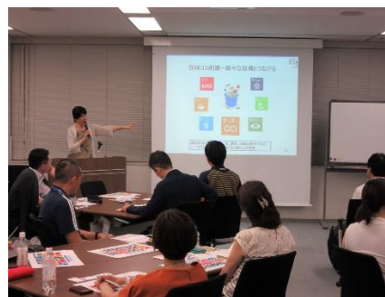
寄付と SDGs を考えるイベント