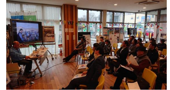
KIFU BAR+「私、10 歳。私の夢は・・・」@佐賀